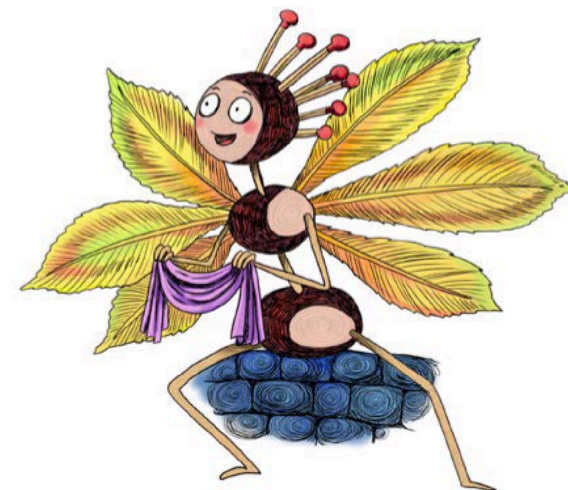
KAŠTÁNEK Symbol a tvář Juniorfestu